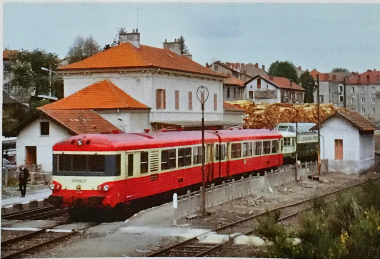
X 4500, autorail panoramique et grumes à Dunières.